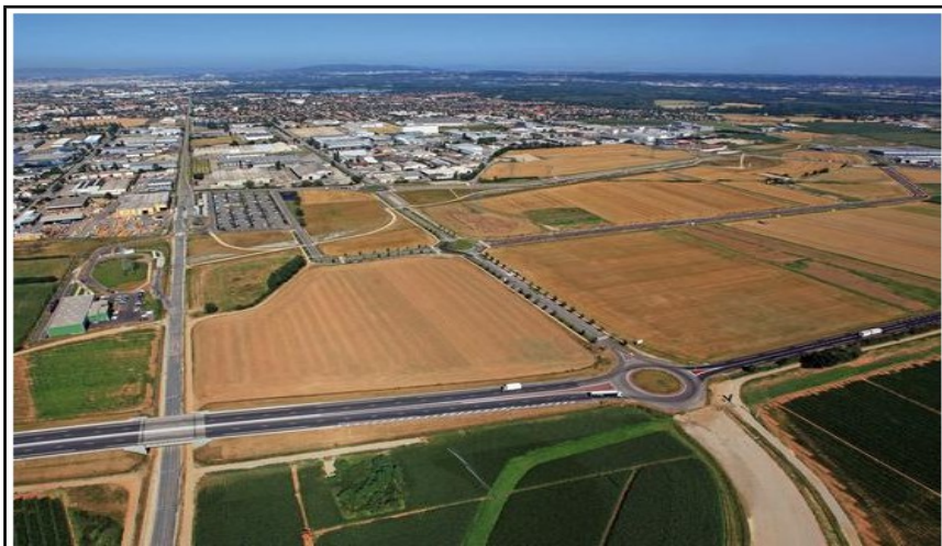
Meyzieu dans la banlieue de Lyon : la Zac (zone d'activité commerciale) des Gaulnes / résidences pavillonnaires / Gare de tramway et futur Parc d'affaires.

1-D'où a été prise la photo et à quelle hauteur approximativement ? - 2 points.